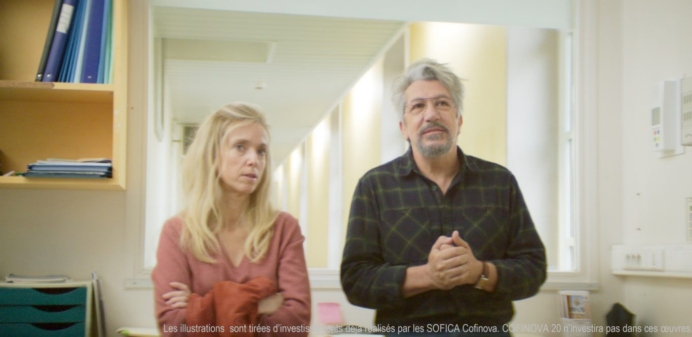
Les illustrations sont tirées d'investissements déjà réalisés par les SOFICA Cofinova. COFINOVA 20 n'investira pas dans ces œuvres.